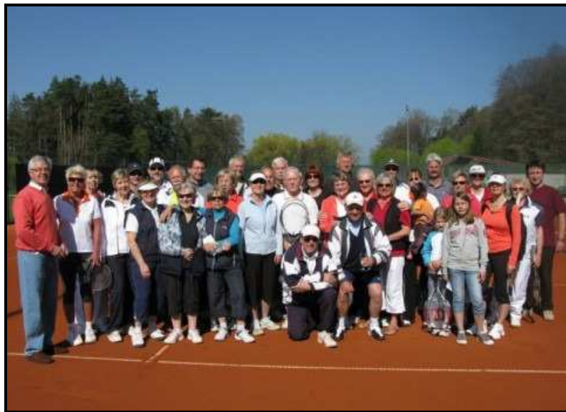
Tennissaison - Eröffnung am 25.4.2010