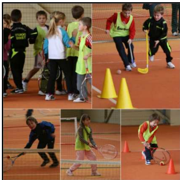
Turnier der Tennis-Kids am 31.1.2010