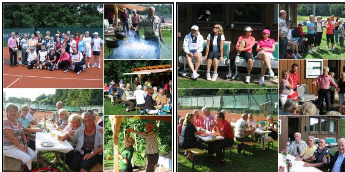
Schnapsschüsse vom Sommerfest 2010

Gute Steaks, knackige Bratwürste und süffiger "Ewig Leben - Wein" sorgten dafür, dass ein größerer Kreis bis spät in die Nacht hinein feierte. Für alle stand fest, dass dieses Sommerfest nach vielen Jahren der Abstinenz wieder zu einem geselligen Bestandteil im Clubleben werden muss.