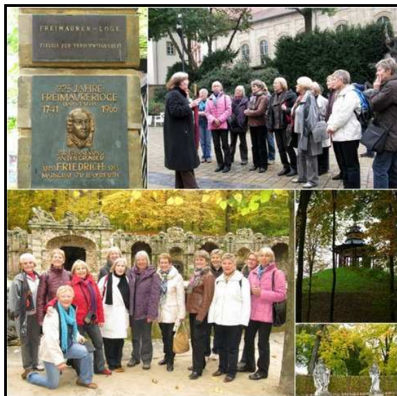
Ausflug der Tennis - Seniorinnen nach Bayreuth am 15. 10.2010