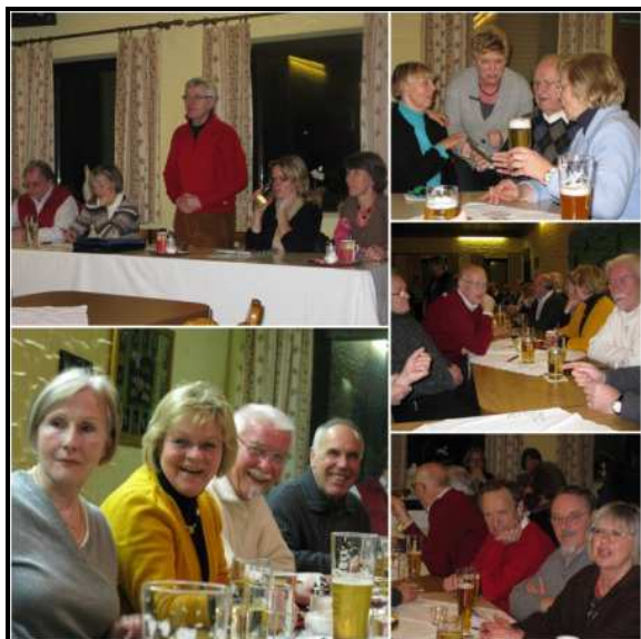
Schnappschüsse von der Jahreshauptversammlung am 26. Februar 2010