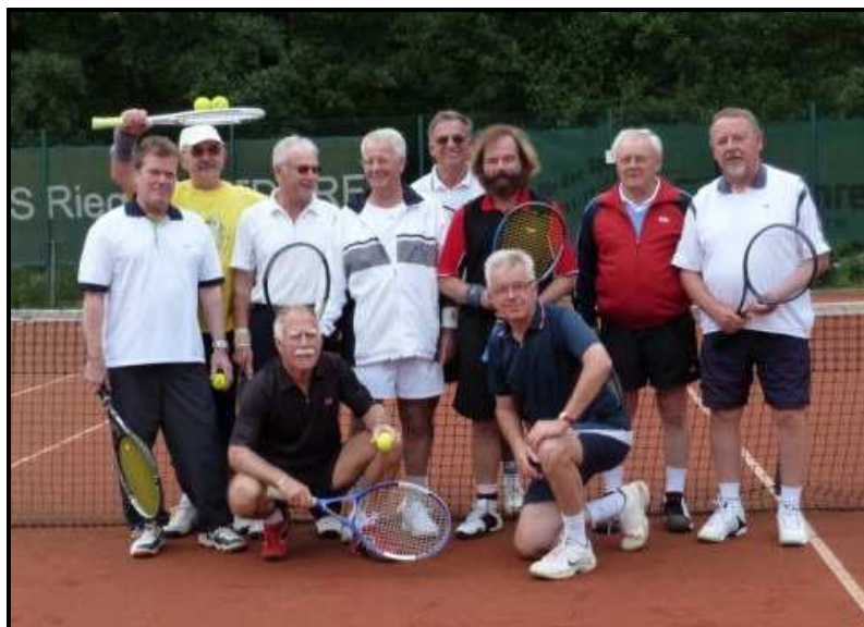
Abschlussturnier der Herren am 4. September 2010