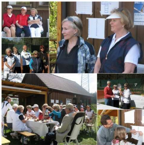
Schnappschüsse vom Eröffnungstag