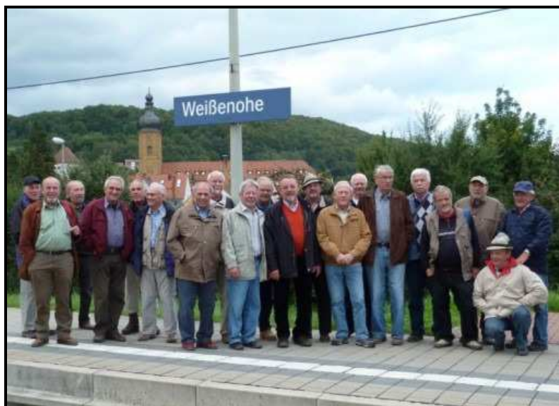
Ausflug der Senioren zum 5 Seidla-Weg